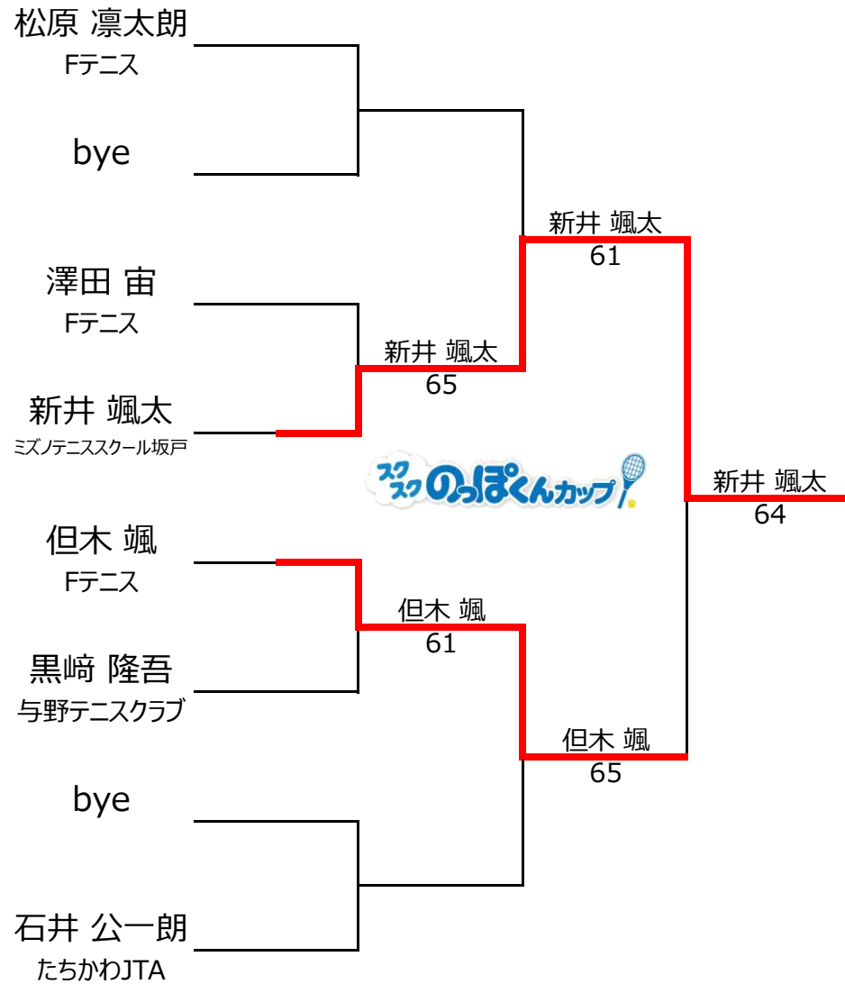
【男子】12歳以下1,2位トーナメント