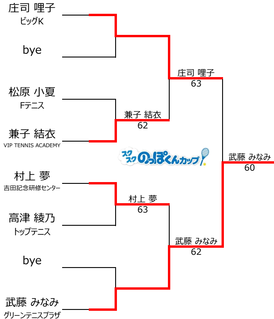
【女子】10歳以下1,2位トーナメント