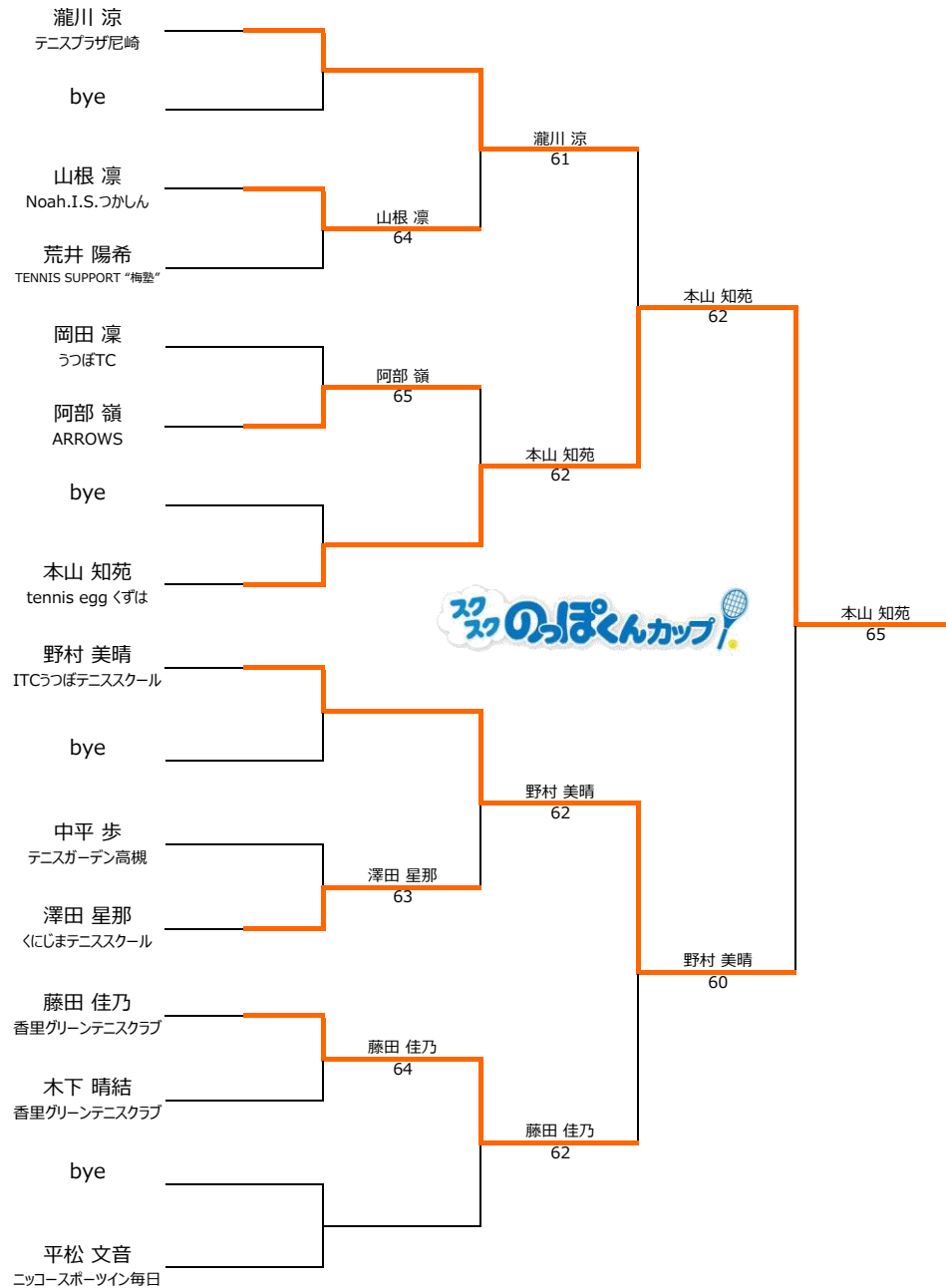
12歳以下1,2位トーナメント