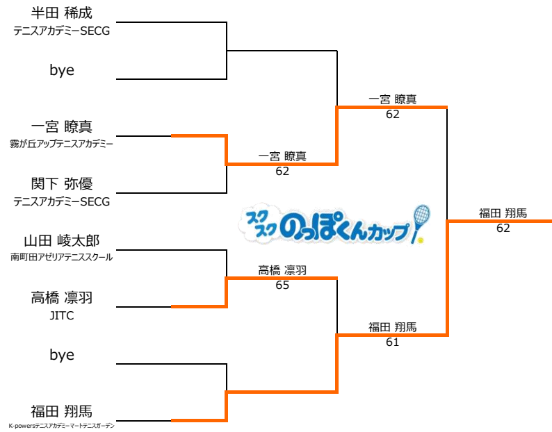
12歳以下1,2位トーナメント