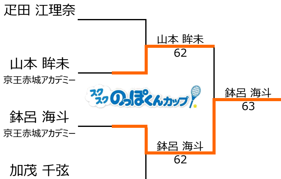
14歳以下1,2位トーナメント