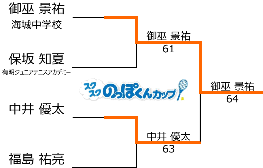
16歳以下1,2位トーナメント