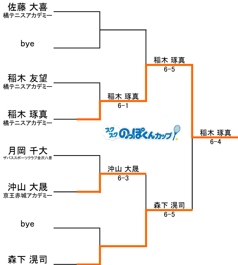
小学校4年生以下1,2位トーナメント